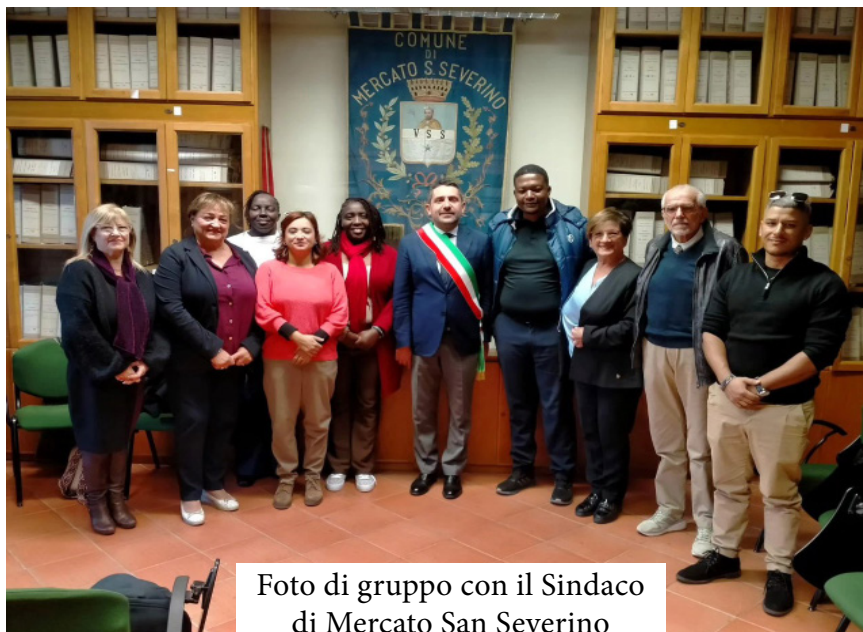
Foto di gruppo con il Sindaco di Mercato San Severino