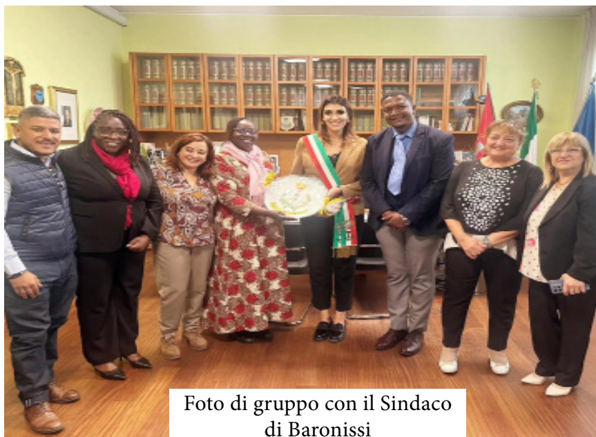
Foto di gruppo con il Sindaco di Baronissi